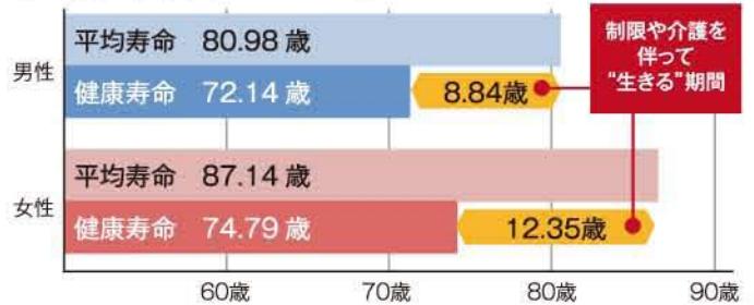
【平均寿命と健康寿命の差/2016年】※厚生労働省資料/平成30年3月

健康に関する正しい知識を学んで、自分の健康状況を理解。その上で、健やかな暮らしの実現を課題に、少しでも健康寿命を延伸する意識を持ち、行動変容につなげます。